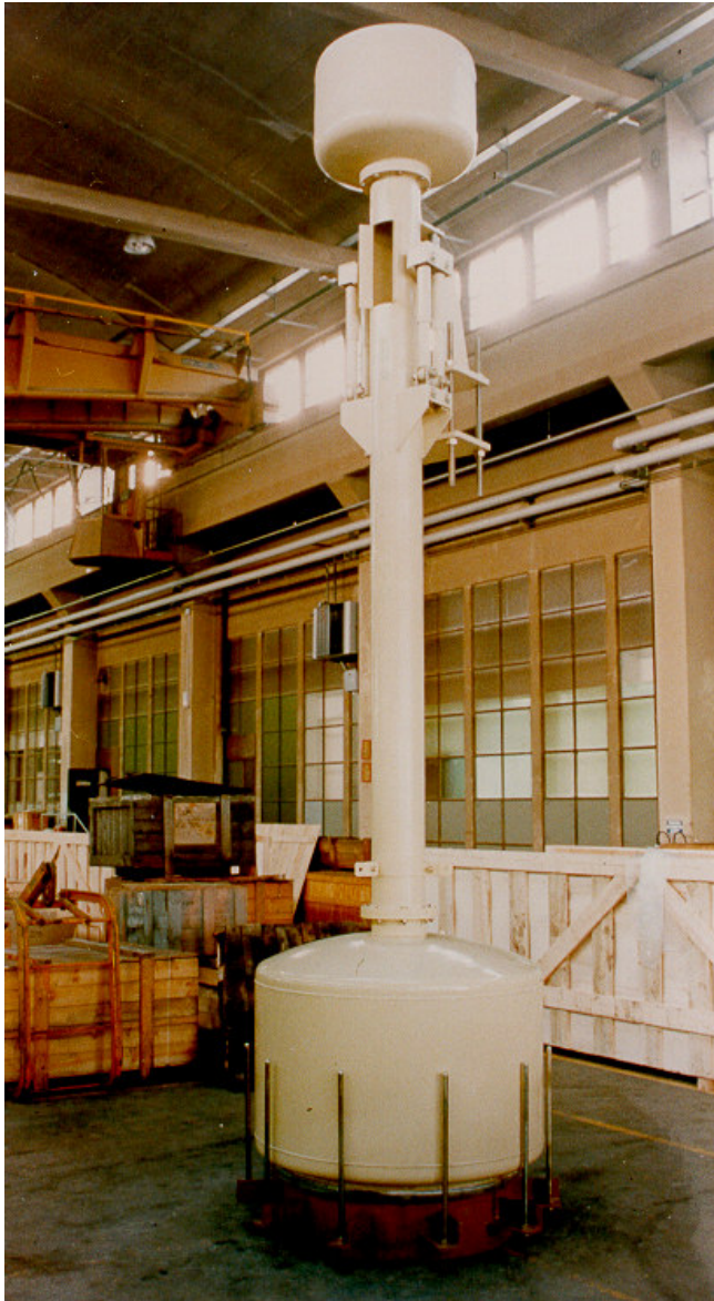
Válvulas Stop® é marca registrada

O enchimento da tubulação obrigatoriamente é efetuado com vazão By-Pass. A abertura da Válvula Stop® é automática quando a tubulação é preenchida.